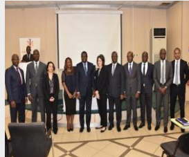
MIM - 8 Fév 18

Des réunions se sont tenues avec différents Ministères relativement aux travaux préparatoires à la mise en œuvre du Compact CI. Ci-dessous quelques-uns, cliquez sur les titres pour avoir plus d'informations.