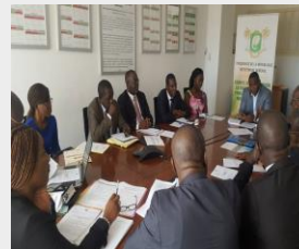
GT Formation Enseignants - 22 Fév 18