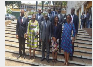
BNETD-19 Fév. 18