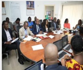
GT-COMM, 27 Fév. 18