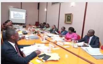
Au cours du Conseil d'Administration

Abidjan le 29 mars 2018 - La première réunion du Conseil d'Administration du Millennium Challenge Account-Côte d'Ivoire (MCA-Côte d'Ivoire) s'est tenue le 29 mars 2018. Présidée par le Secrétaire Général de la Présidence de la République, M. le Ministre Patrick Achi, la rencontre, qui fait suite à la signature, en Novembre 2017 aux États-Unis, de l'Accord de don du Compact Côte d'Ivoire d'un montant de 524 740 000 dollars, a permis d'adopter des mesures relatives à la mise en œuvre du Programme Compact Côte d'Ivoire.