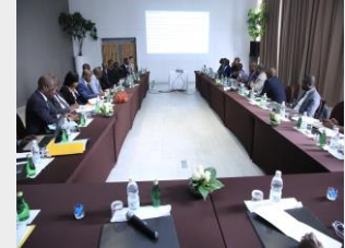
Mission Transport 12-16 Fév 18