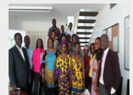
Rencontre d'informations avec la Société Civile 5 Mars 2018

Partie prenante au programme Compact, la société civile ivoirienne est conviée à des réunions avec la Coordination Nationale. Ces rencontres sont l'occasion d'informer la société civile sur l'état d'avancement du programme Compact mais également de prendre en compte les avis et suggestions de celle-ci en vue de leur prise en compte.