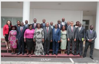
Les membres du Conseil d'Administration