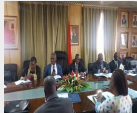
MENETFP - 9 Fév. 18